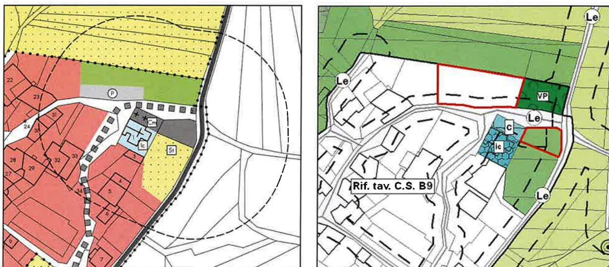
Esempio: modifiche apportate ad aree soggette a vincolo espropriativo nella frazione di Padaro in funzione del reale utilizzo delle aree

modificato notevolmente il fabbisogno di spazi per aree cimiteriali rispetto a quelle definite nel 2000. Si è pertanto ritenuto che non sia più necessaria la previsione di area di ampliamento del cimitero di Padaro. Visto il procedimento di variante in atto si è provveduto quindi all'assegnazione della destinazione d'uso in base all'effettivo utilizzo della particella (uso agricolo). Tale modifica, comporta, di conseguenza, anche la variazione della fascia di rispetto cimiteriale, così come specificato al capitolo 2 della relazione (II) riguardante le "Modifiche al P.R.G. conseguenti la variante al Piano Regolatore Generale di Arco per la disciplina degli edifici ricompresi nel centro storico di Arco e frazioni e degli edifici storici isolati" parte integrante della delibera di prima adozione della variante.