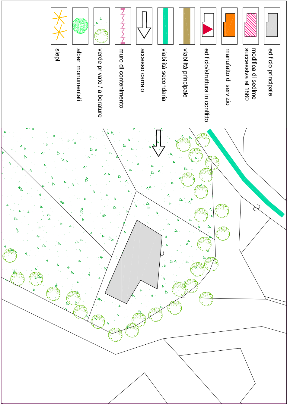
schema planimetrico dello stato di fatto su base catastale [scala 1:500]