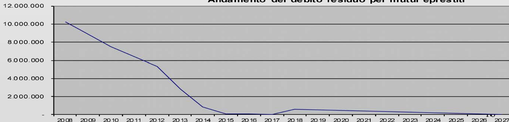
Andamento del debito residuo per mutui eprestiti